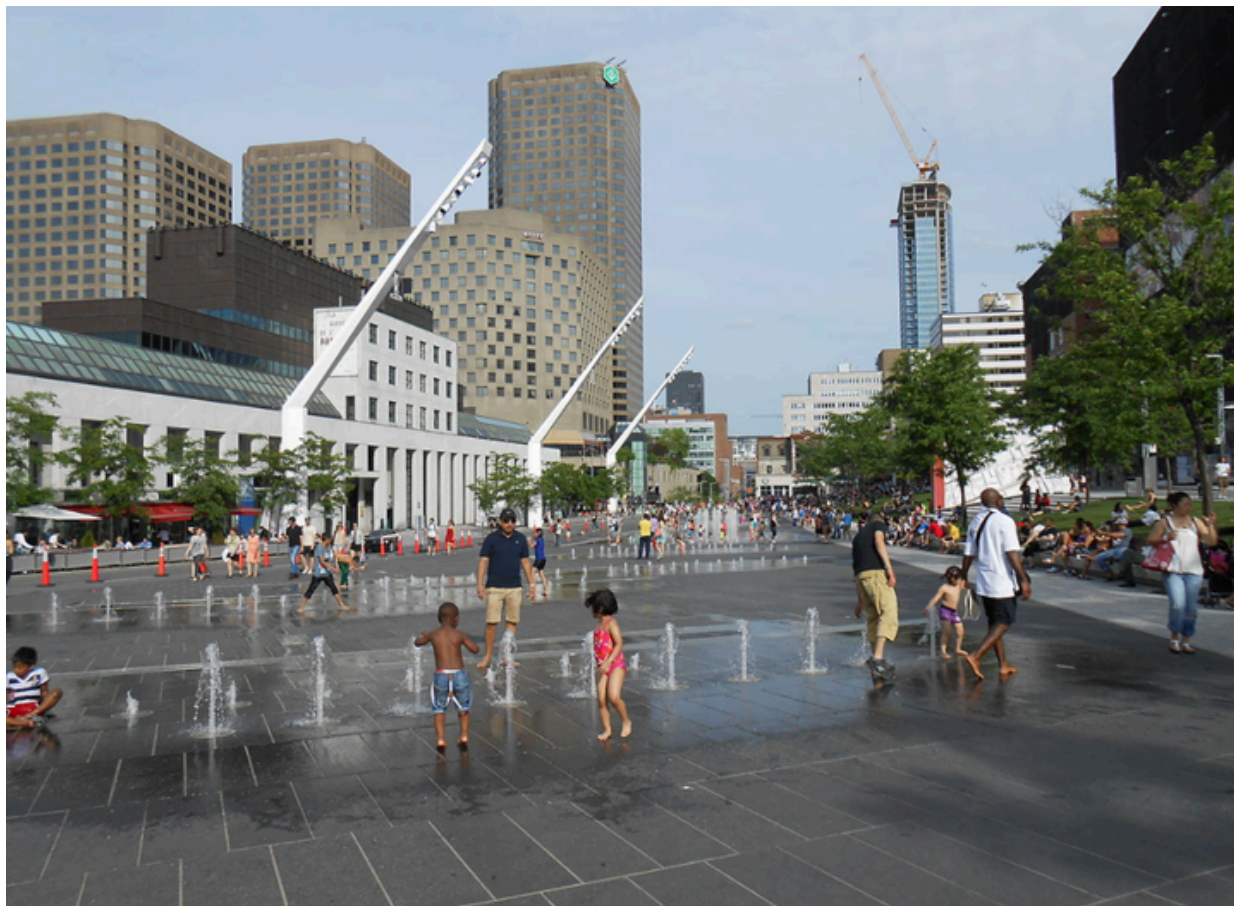
Quartier des spectacles

Si je prends l'autobus scolaire ou un véhicule, je vais descendre près de l'Esplanade dans le Quartier des spectacles. Il est possible de se stationner dans le stationnement de la Place des Arts.