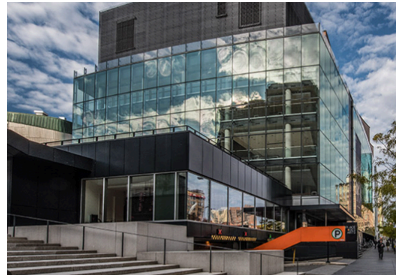
Stationnement de la Place des Arts