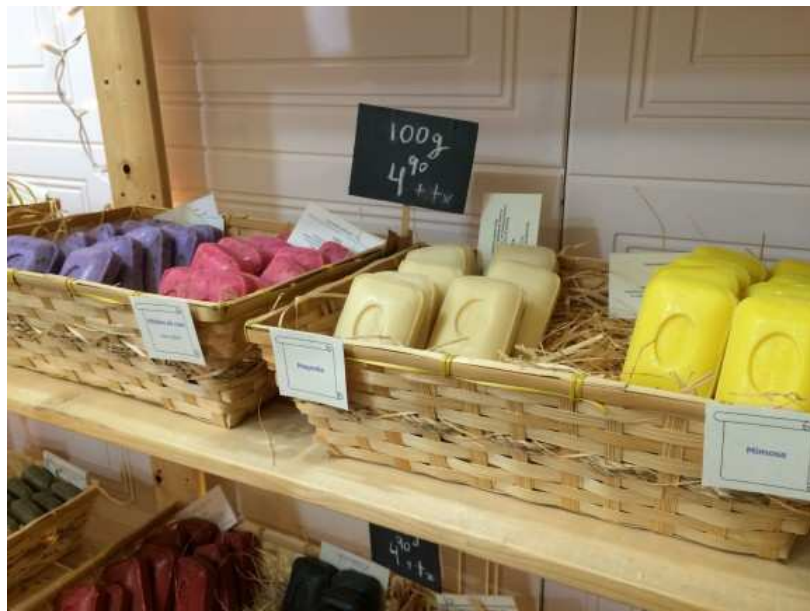
Savons de Marseille