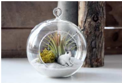
Crown Flora Studio

Publié le novembre 19, 2014 par enmodequinqua