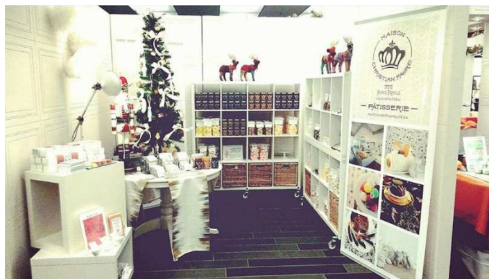
The Maison Christian Faure booth at the Nutcracker Market.

Where: 111 Roy St. E., 514-284-9335, santopolroulant.org