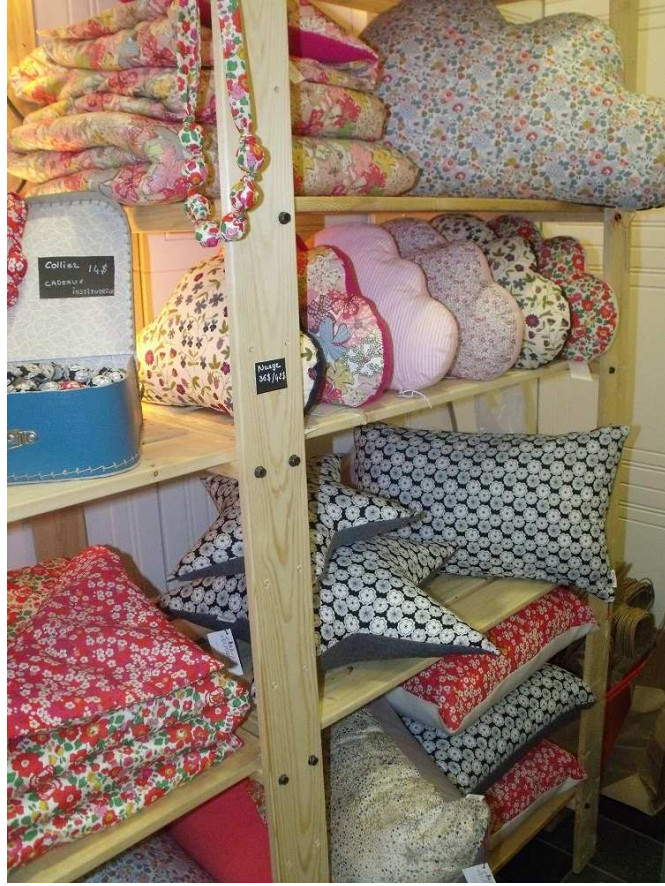
Les assortiments d'herbes, de graines et de fleurs de Tamara Serrao , qui fabrique également ses propres textiles.