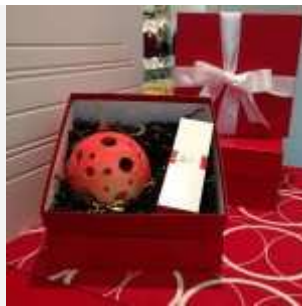
La Maison du Macaron - Marché Casse-Noisette