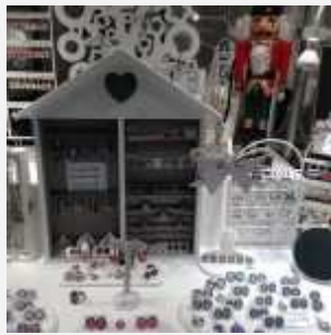
Bijoux Crazy Lily - Marché Casse-Noisette