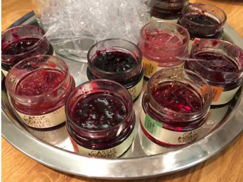
Produits à base de cassis