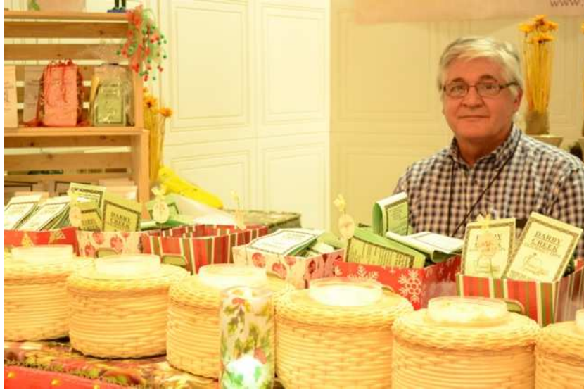
Gamines & Cie