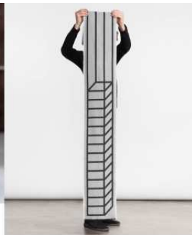
String theory scarves