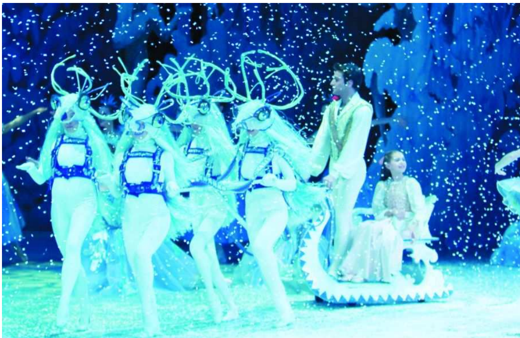
Casse-NoisetteCe texte fait partie d'un cahier spécial.

29 novembre 2014 | Christophe Huss | Musique