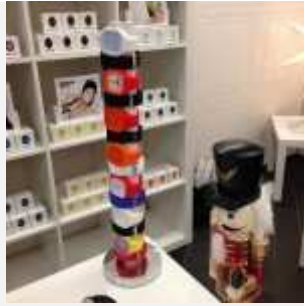
Rainbow Watch - Marché Casse-Noisette

Avez-vous prévu de faire un tour au Marché Casse-Noisette ?