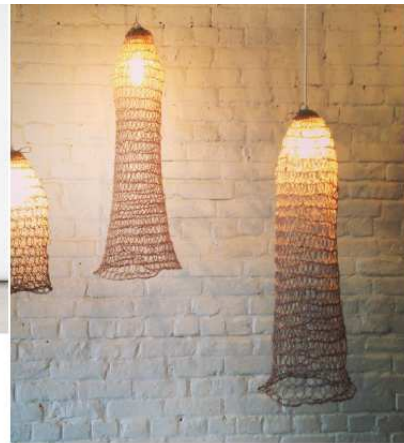
Amulette par Annie Legault

Chaque année, ma visite des marchés de Noël, c'est un rituel. Voire une ritournelle... de Noël! Impossible de m'en passer. Tantôt sous forme de marché aux puces, de souk ou de foire plus traditionnelle, ces marchés sont un réconfort pour mon âme dans le tourbillon de consommation qui précède Noël.