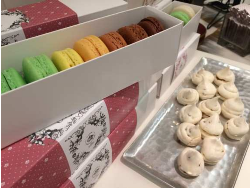
Gourmandises de la maison Christian Faure